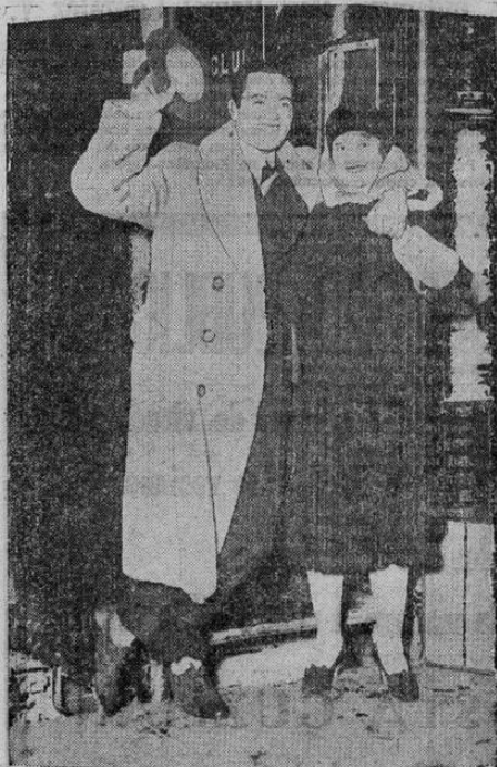
El popular artista de cine Buddy Rogers aparece aquí en el momento de llegar a Nueva York a visitar a su madre