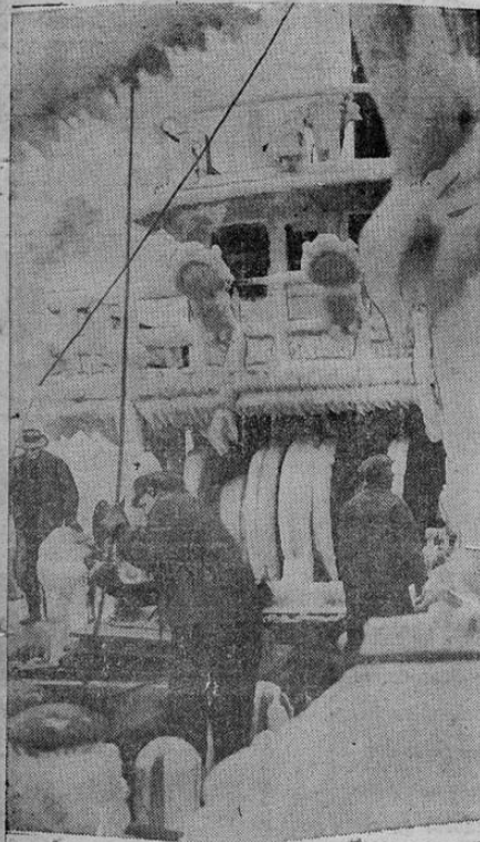
Un frio intenso ha estado azotando el norte del Atlántico, y hace pocos días una embarcación del servicio de guardacostas norteamericano encontró dos pescadores muertos por el frio en un bote. La foto muestra el barco LOON al llegar a Nueva York, cubierto de hielo

La nota pa'pitante del día la constituyen los casos de viruela descubiertos últimamente en esta capital, por cuyo motivo, como puede apreciarse en la anterior foto, todos los vecinos acuden a la secretaria de salubridad a vacunarse contra el terrible mal. Y en el hospital de San Juan de Dios, con motivo de atenderse ahí a dos atacados de viruela, se han tomado medidas precautorias, pues como también puede verse en la foto, se ha prohibido terminantemente al público hacer visitas a ese establecimiento, hasta segunda orden